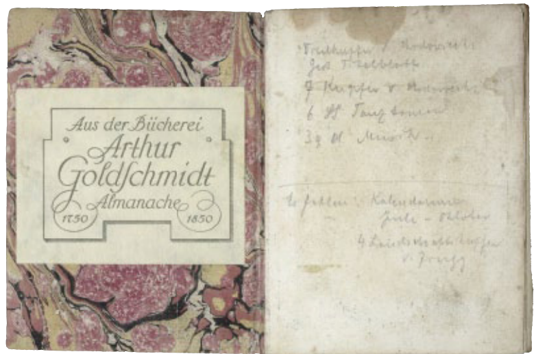
W. G. Becker: Almanach und Taschenbuch zum geselligen Vergnügen. Leipzig: Roch und Weigel, 1800. Mit Exlibris von Arthur Goldschmidt.