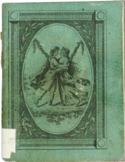
Taschenbuch auf das Schaltjahr 1804. Für Freunde und Freundinnen des Schönen und Nützlichen, besonders für edle Gattinnen und Mütter und solche die es werden wollen. Leipzig: Hinrichs.